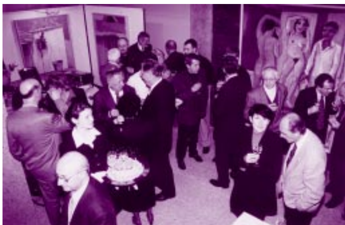
Po podelitvi je bilo poskrbljeno tudi za družabno srečanje.

člankih in sestavkih na mednarodnih konferencah. Te članke so drugi avtorji vsaj dvanajstkrat citirali. Delo je nastajalo v okviru projekta SENSATIONS v četrtem okvirnem programu Evropske skupnosti. Tako je imel kandidat ves čas priliko poročati o svojih rezultatih pred elitnimi evropskimi raziskovalci. Njegova poročanja so vzbudila znatno zanimanje za njegovo delo in pripomogla k še večjemu mednarodnemu ugledu ljubljanskih bioinženirjev.