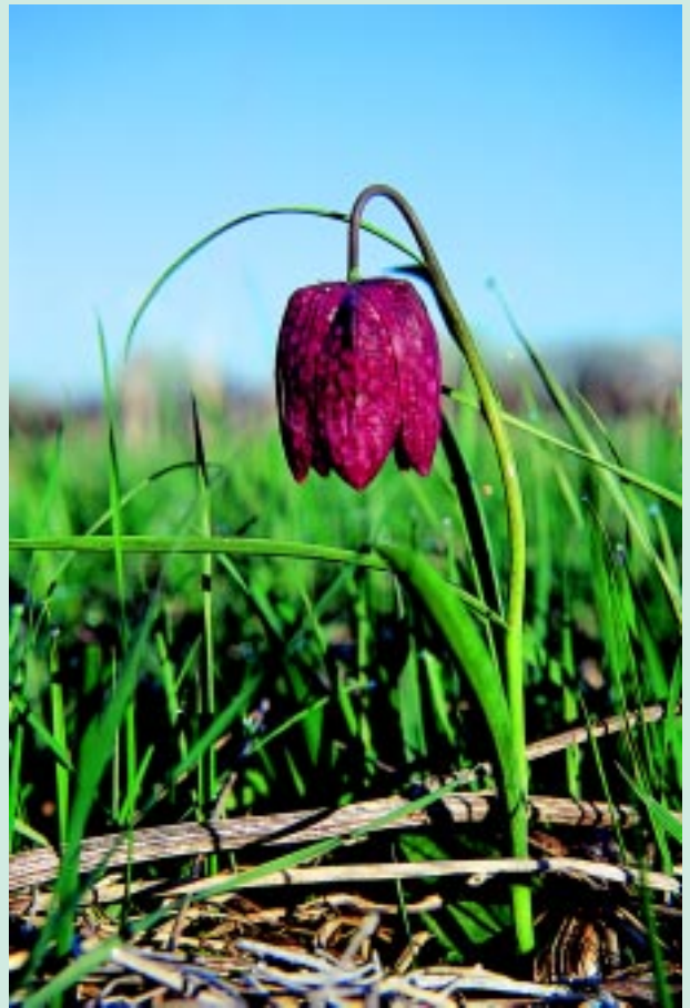
Močvirska logarica.