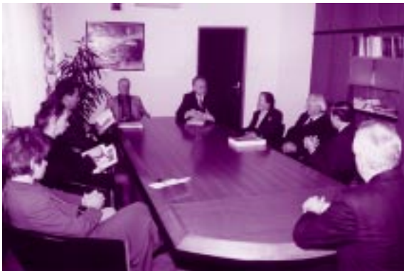
Sprejem pri direktorju

Institut »Jožef Stefan« je letos že osmo leto zapored priredil v tednu od 20. do 24. marca Dneve Jožefa Stefana. V dnevih, ko se spominjamo velikega slovenskega fizika, institut na široko odpre svoja vrata vsem obiskovalcem, ki jih zanimajo poljudne in strokovne teme zanimivih predavanj, slikarske razstave ali pa delo raziskovalcev v njihovih laboratorijih.