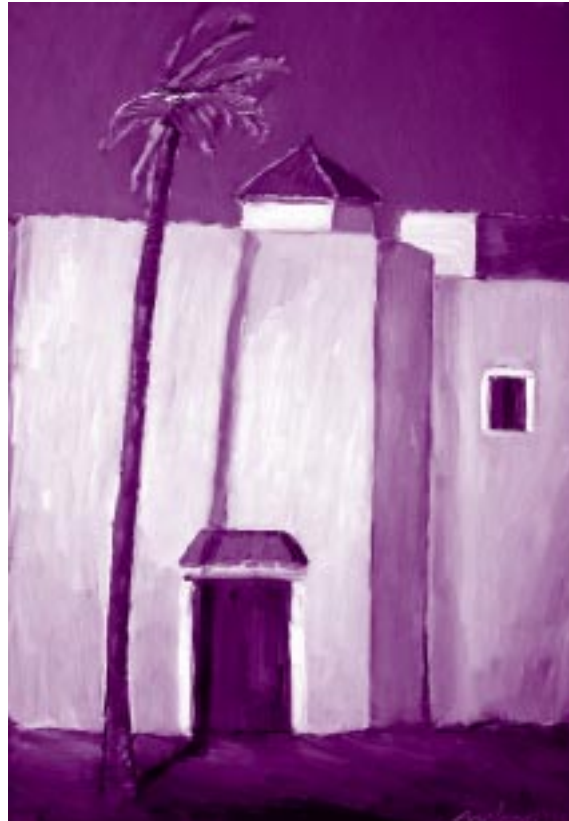
Palma in Casbah, 1990, olje na platnu, 200 x 140 cm