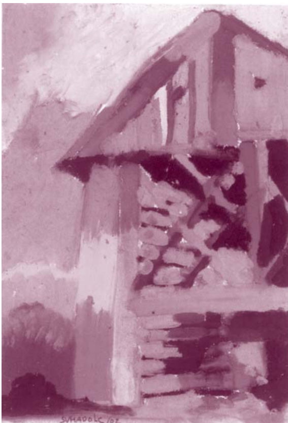
Rogatec, 2002, pastel na papirju, 21 x 14,8 cm

Janez Suhadolc. Rojen 3. julija 1942 v Ljubljani. Leta 1968 je diplomiral na Fakulteti za arhitekturo v Ljubljani, kjer od leta 1972 predava prostoročno risanje in oblikovanje predmetov. Poleg tega se ustvarjalno ukvarja z grafičnim oblikovanjem, arhitekturnim načrtovanjem interierov, preureditvami muzejskih prostorov, s postavitvami razstav, z unikatnim oblikovanjem in izdelovanjem lesenih pohištvenih prototipov – kot oblikovalec je najbolj znan po seriji stolov, narejenih iz različnih materialov, v ospredju je seveda les – ter s slikanjem in pisanjem. V Sloveniji in tujini je imel več samostojnih razstav, na katerih je pokazal svoje oblikovalske izdelke ter večkrat tudi svoje likovno ustvarjanje. Živi in ustvarja v Ljubljani.