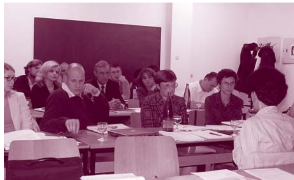
Slika 2: Prvi sestanek sodelujočih pri projektu SARIB je potekal na našem institutu.