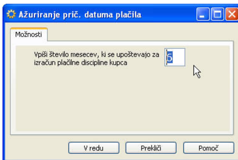
Slika 8: Ažuriranje prič. Datuma plačila

Obdelavo moramo zagnati pred vsako analizo likvidnosti.